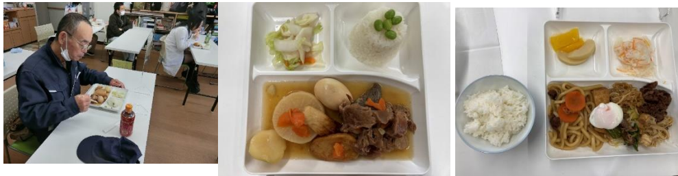
冬には「おでん」に「すきやきうどん」(・▽・)イイね!